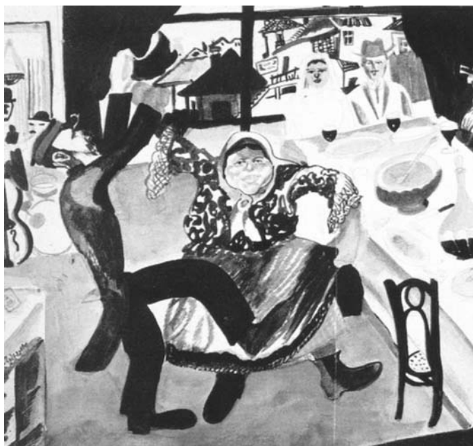
Марк Шагал „Еврейская свадьба„ (фрагмент)