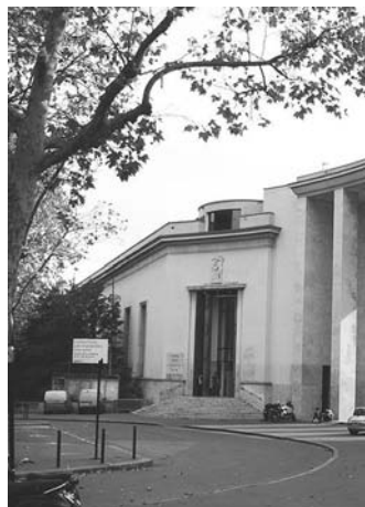
Парижский музей современного искусства

ставке, сделаны во время Израильской военной операции «Литой свинец». Виденхофлер находился в это время в Газе под покровительством бандитов ХАМАСа и фотографировал «мирных» жителей, пострадавших от военных действий. За свои работы