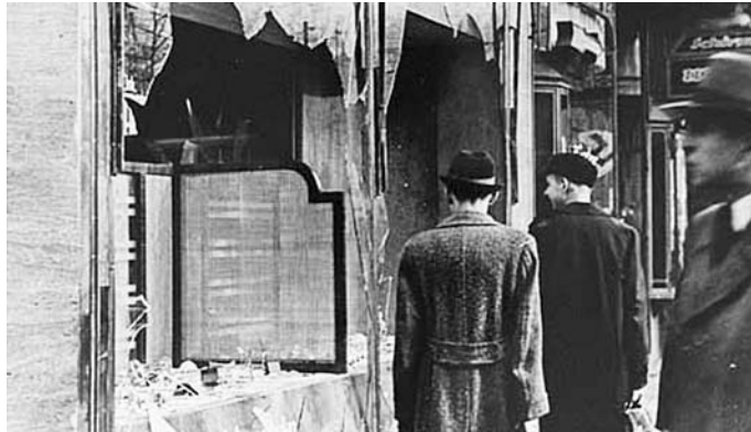
После погрома. Ноябрь 1938

Бранденбург, подчеркнул, что эти призывы местных политиков воспринимаются сегодня скорее как насмешка: ведь в земле Бранденбург невозможно сегодня снова поджечь синагоги, еврейские школы, детские