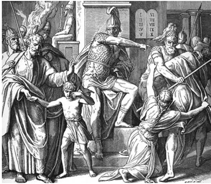
Antiochus verfolgt die gläubigen Israeliten - 1. Makkabäer 1, 65 - 67.

liche Armeen zu schlagen und schließlich sogar, in 164 v.d.Z. (3598) Jerusalem zurückzuerobern, während die größten syrischen Kräfte mit dem anderen Krieg beschäftigt waren und deswegen nicht gegen die Juden eingesetzt werden konnten.